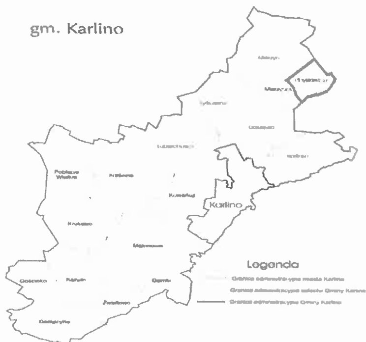
Rys. nr 1. Mapa obrazująca położenie miejscowości Ubysławice w gminie Karlino